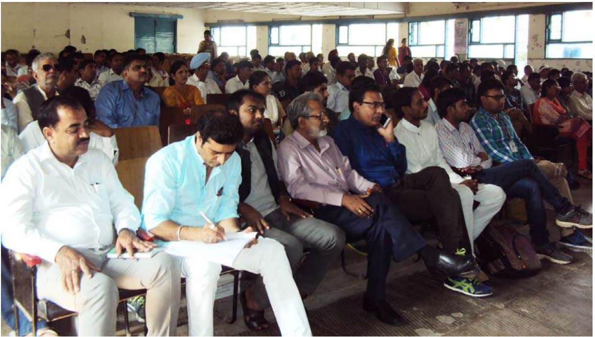
सेमिनार में उपस्थित श्रोतागण

आज हरियाणा की संस्कृति एक मुश्किल दौर से गुजर रही है। औद्योगिककरण, शहरीकरण और शिक्षा के प्रसार के बढ़ते सदियों पुरानी किसान संस्कृति अपने अस्तित्व की लड़ाई लड़ रही है। कृषि क्षेत्र का महत्व लगातार कम हो रहा है। इसका उत्पादन व रोजगार में हिस्सा घट रहा है। गैर कृषि व्यवसायों से रोजी-रोटी कमाने वालों की संख्या बढ़ रही है। किसानों की अपनी ही पहचान